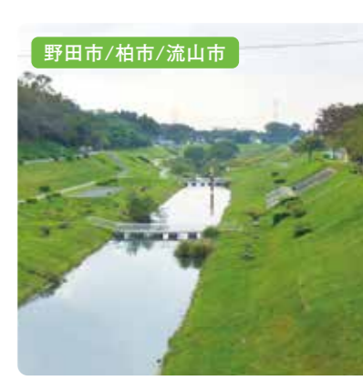
野田市/柏市/流山市